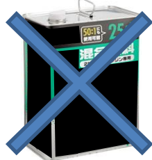
一度開封した混合油販売用容器等