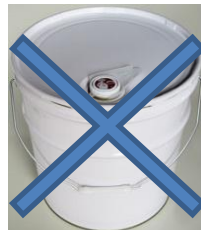
一度開封したペール缶

これらの容器には、ガソリンスタンド等でガソリンの詰め替えができません。たとえ、KHK・UNマークが入っている容器でも、繰り返し使用する想定がなされていないため、開封後再び運搬容器として使用できません。