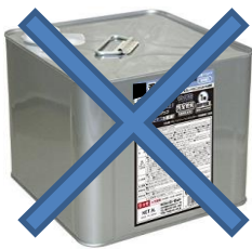
一度開封した一斗缶